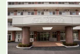
社会福祉法人共助会 福寿園ひばりが丘 (98人) 東京都西東京市ひばりが丘3-1-18