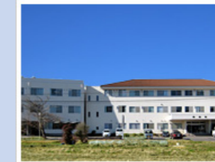
医療法人社団寿光会 岬病院 (198床) 千葉県いすみ市岬町桑田2531