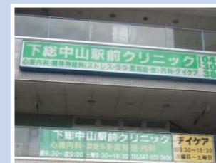
医療法人静和会 下総中山駅前クリニック 千葉県船橋市本中山2-16-1