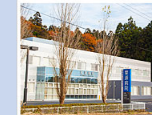
医療法人社団寿光会 栗源病院 (165床) 千葉県香取市助沢832-1