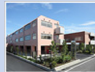
医療法人社団純正会 八王子北部病院 (172床) 東京都八王子市川口町1540-19