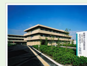
医療法人社団寿光会 エスポワール市川 (100人) 千葉県市川市高谷3-1-20