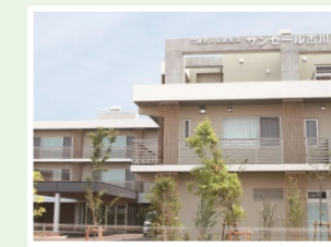
医療法人社団寿光会 サンセール市川 (100人) 千葉県市川市原木2-1046-1