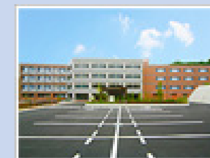
医療法人社団純正会 青梅東部病院 (180床) 東京都青梅市黒沢1-619-9