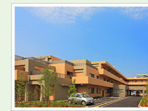
医療法人社団寿光会 エスポワール成田 (100人) 千葉県成田市宝田360-1