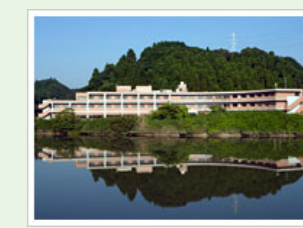
医療法人社団寿光会 エスポワール大原 (100人) 千葉県いすみ市日在2623