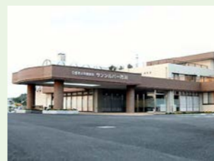
医療法人静和会 サンシルバー市川 (130人) 千葉県市川市北方町4丁目1460