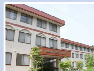
医療法人静和会 中山病院 (337床) 千葉県市川市中山2-10-2