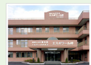
医療法人社団寿光会 エスポワール岬 (100人) 千葉県いすみ市岬町和泉330-1