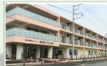
社会福祉法人共助会 福寿園みなみ野 (100人) 東京都八王子市みなみ野6-21-1