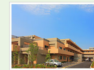
医療法人社団寿光会 エスポワール成田 (100人) 千葉県成田市宝田360-1