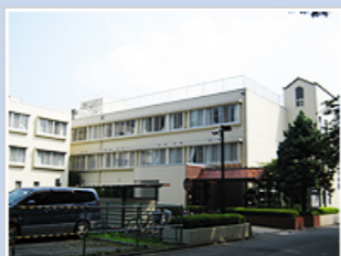
医療法人社団明雄会 北所沢病院 (96床) 埼玉県所沢市下富1270-9