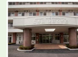
社会福祉法人共助会 福寿園ひばりが丘 (98人) 東京都西東京市ひばりが丘3-1-18