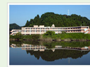
医療法人社団寿光会 エスポワール大原 (100人) 千葉県いすみ市日在2623