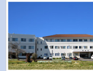
医療法人社団寿光会 岬病院 (198床) 千葉県いすみ市岬町桑田2531