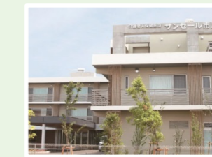
医療法人社団寿光会 サンセーラー市川 (100人) 千葉県市川市原木2-1046-1