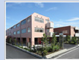
医療法人社団純正会 八王子北部病院 (172床) 東京都八王子市川口町1540-19