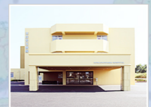
医療法人社団明雄会 本庄児玉病院 (120床) 埼玉県本庄市児玉町児玉7 2 0