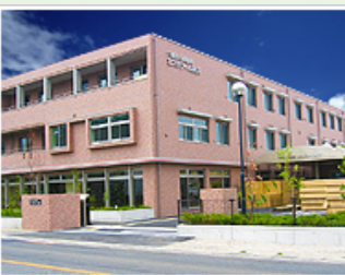
医療法人社団明雄会 エスポワール所沢 (100人) 埼玉県所沢市下富1310-15

幸手南キャンパス (敷地面積：50,159㎡) 保健医療学部 理学療法学科 埼玉県幸手市平須賀2-555 (2017年4月開設)