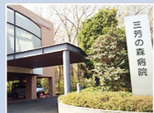
医療法人社団明雄会 三芳の森病院 (240床) 埼玉県入間郡三芳町上富1686