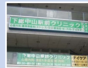
医療法人静和会 下総中山駅前クリニック 千葉県船橋市本中山2-16-1