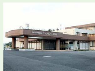
医療法人静和会 サンシルバー市川 (130人) 千葉県市川市北方町4丁目1460