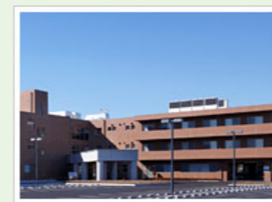
医療法人社団寿光会 エスポワール松戸 (100人) 千葉県松戸市五香西4-26-10