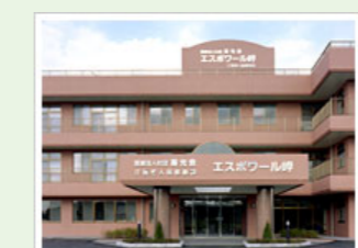
医療法人社団寿光会 エスポワール岬 (100人) 千葉県いすみ市岬町和泉330-1