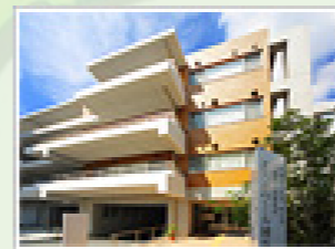
医療法人社団純正会 エスポワール練馬 (32人) 東京都練馬区関町東1-1-9