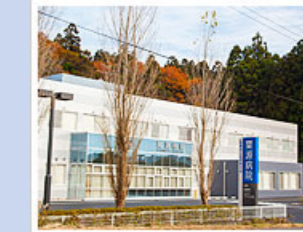
医療法人社団寿光会 栗源病院 (165床) 千葉県香取市助沢832-1