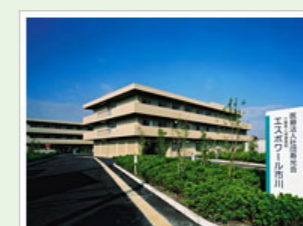
医療法人社団寿光会 エスポワール市川 (100人) 千葉県市川市高谷3-1-20