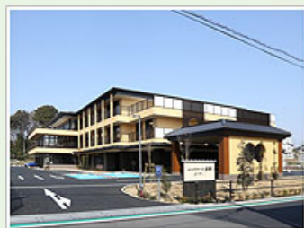
医療法人社団明雄会 エスポワール岩槻 (100人) 埼玉県さいたま市岩槻区 大字表慈恩寺字南541-1