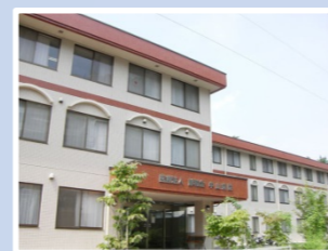
医療法人静和会 中山病院 (337床) 千葉県市川市中山2-10-2