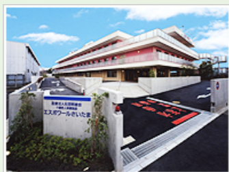
医療法人社団明雄会 エスポワールさいたま (100人) 埼玉県さいたま市緑区 大字大門1548-7