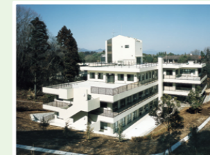
社会福祉法人共助会 サンシルバー町田 (100人) 東京都町田市相原町2373-1