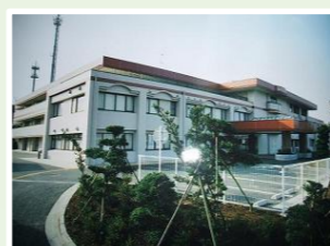
社会福祉法人共助会 福寿園横浜 (120人) 横浜市神奈川区菅田町2331-1