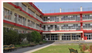
学校法人共済学院 日本保健医療大学

幸手北キャンパス (敷地面積：20,309㎡) 保健医療学部 看護学科 埼玉県幸手市幸手1961-2