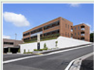
医療法人社団純正会 エスポワール和泉 (100人) 神奈川県横浜市泉区和泉町2604-1