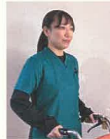
2年目 理学療法士 院内勤務

入社して1年になります。回復期病棟で勤務しています。原田病院で働いていいと思うことは、月に2回の若手研修会があり、座学や実技などリハビリについて幅広く学ぶ機会があることです。また、先輩と気軽にコミュニケーションがとれて、相談がしやすいことです。急性期病棟や訪問リハビリの部署もありますが、まず回復期病棟で一人前になることを目標に日々努力しています。