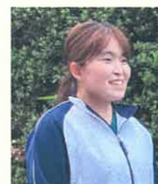
3年目 理学療法士 訪問リハビリ

原田病院に入社し8年になります。現在はグループ長をしています。原田病院でのやりがいは、外部研修の参加や実習生の指導者講習を積極的に支援してもらえるので自己研鑽しやすいことです。また、研修会の講師を務めたり、OJTによる後輩指導を経験できることです。