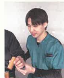
8年目 作業療法士 グループ長

入社して1年になります。回復期病棟で勤務しています。原田病院で働いていいと思うことは、月に2回の若手研修会があり、座学や実技などリハビリについて幅広く学ぶ機会があることです。また、先輩と気軽にコミュニケーションがとれて、相談がしやすいことです。急性期病棟や訪問リハビリの部署もありますが、まず回復期病棟で一人前になることを目標に日々努力しています。