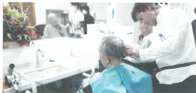
美容室 月2回理美容師が来て有料でカットをします(カットのみ)