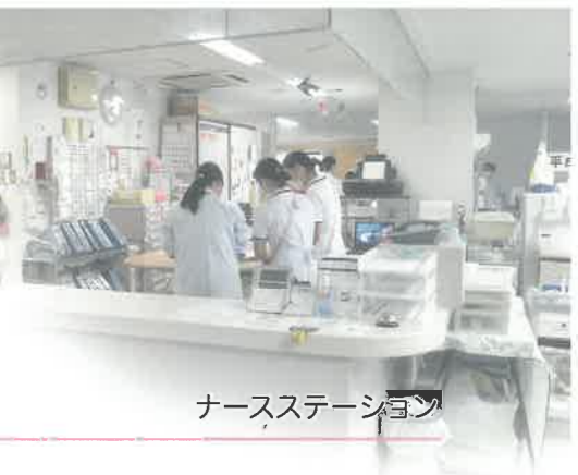
ナースステーション