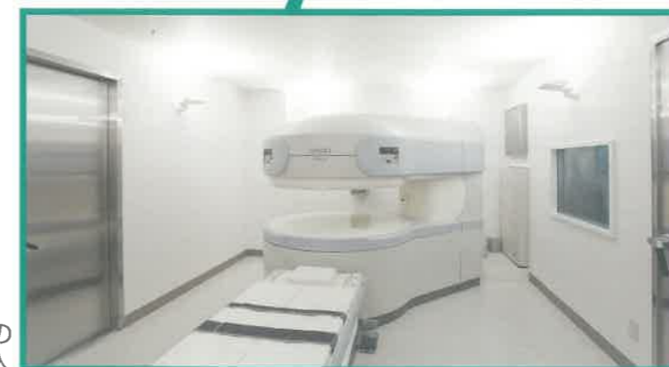
最新の Open MRI導入