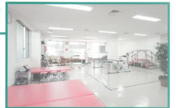
リハビリテーション科