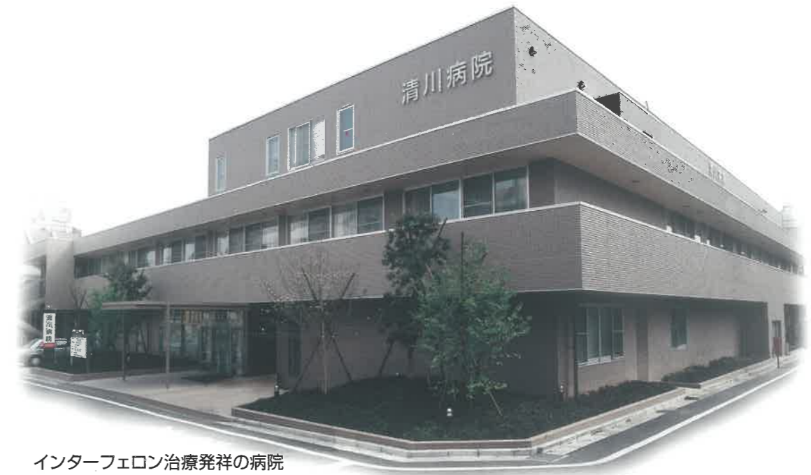
インターフェロン治療発祥の病院