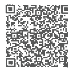
見学エントリーフォーム

人生の先輩がたくさんいます。困ったことは、なんでも相談できます。お一人暮らしは、住宅補助が充実しています。