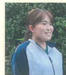
3年目 理学療法士 訪問リハビリ

原田病院に入職し8年になります。現在はグループ長をしています。原田病院でのやりがいは、外部研修の参加や実習生の指導者講習を積極的に支援してもらえるので自己研鑽しやすいことです。また、研修会の講師を務めたり、OJTによる後輩指導を経験できることです。