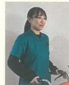
2年目 理学療法士 院内勤務

入職して1年になります。回復期病棟で勤務しています。原田病院で働いていいと思うことは、月に2回の若手研修会があり、座学や実技などリハビリについて幅広く学べる機会があることです。また、先輩と気軽にコミュニケーションがとれて、相談がしやすいことです。急性期病棟や訪問リハビリの部署もありますが、まず回復期病棟で一人前になることを目標に日々努力しています。