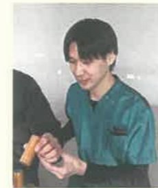
8年目 作業療法士 グループ長

入職して1年になります。回復期病棟で勤務しています。原田病院で働いていいと思うことは、月に2回の若手研修会があり、座学や実技などリハビリについて幅広く学べる機会があることです。また、先輩と気軽にコミュニケーションがとれて、相談がしやすいことです。急性期病棟や訪問リハビリの部署もありますが、まず回復期病棟で一人前になることを目標に日々努力しています。