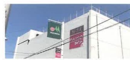
スタッフ御用達スーパー！