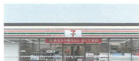
近隣に2件のセブンイレブン