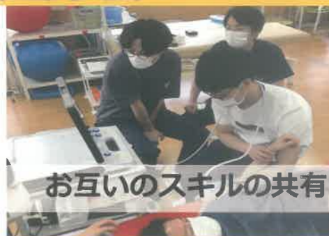
お互いのスキルの共有

カリキュラムが組まれており、何を優先して学ぶべきか、目標が明確になっています。休憩の時間や朝の時間などに臨床やそれ以外の悩みも優しい先輩方が聞いてくれます！！この皆さんはとても優しく相談に乗ってくれる心強い先輩ばかりです！！