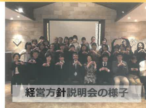
経営方針説明会の様子

また、 定期的に懇親会などを開催 し、コミュニケーションをはかる機会があります。お子様がいるスタッフが行事などで休みの場合、フォローしあう文化があります。