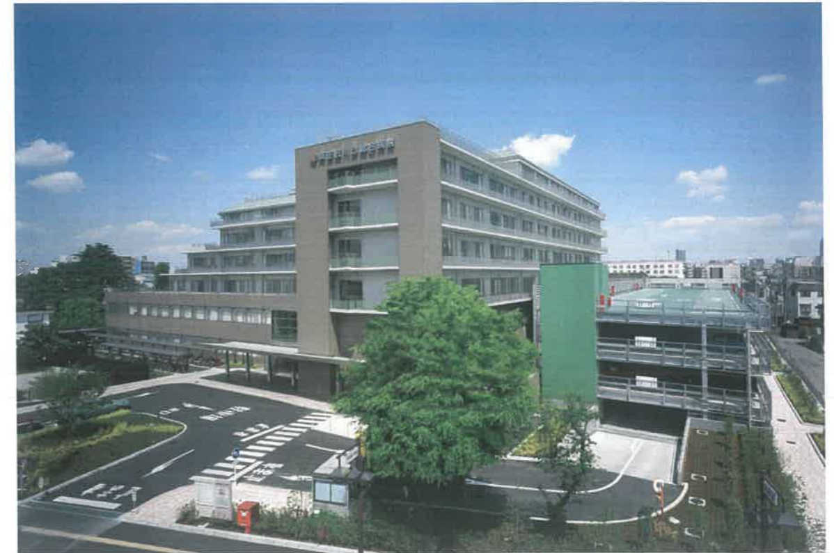
患者さんを中心とした質の高い医療の提供により地域・社会に貢献します