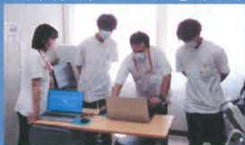
クラスターミーティング