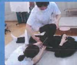
リハビリ室での共同介入