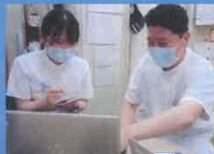
カルテからの情報収集