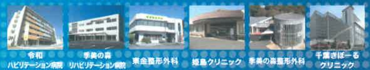
令和リハビリテーション病院 季美の森リハビリテーション病院 東金整形外科 姫島クリニック 季美の森整形外科 千葉きぼるクリニック

現場で働くスタッフとコミュニケーションをとっていただき、 職場の雰囲気や取り組みなどを体感してもらいます。 当日は2~3施設の見学を予定しております。