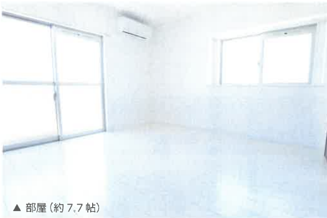
▲ 部屋 (約 7.7 帖)