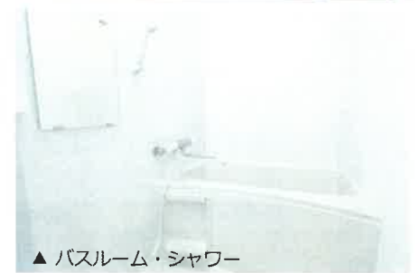
▲ バスルーム・シャワー