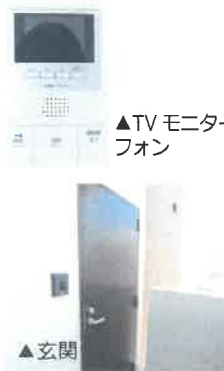
▲ TV モニター フォン