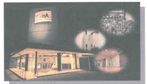
メディカルフィットネス&トレーニングセンター 「VITAS」ヴィータス 平成28年7月2日～OPEN