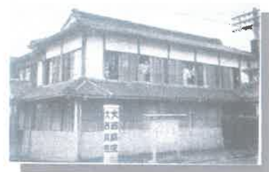
大西病院時代 (昭和30年頃)