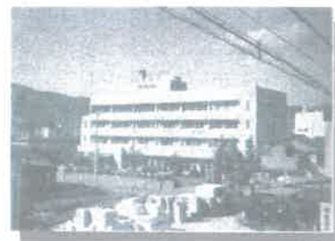
更埴中央病院時代 (昭和40年代後半)