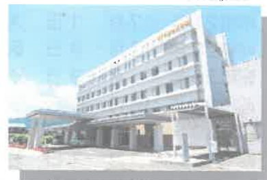
第5期新本館増築及び既存棟改修工事 平成25年10月31日竣工