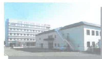
社会福祉法人大西福祉会 特別養護老人ホーム 「メディケア 千曲中央」 平成29年4月1日～OPEN