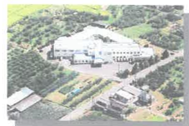
介護老人保健施設 ひまわり 平成9年6月5日～OPEN