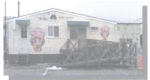
千曲市委託事業 「病児・病後児保育室 あぶりこっこ」 平成28年3月1日～OPEN