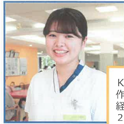
K. M 作業療法士 経験2年目 2019年新卒入職