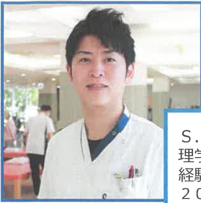
S. H 理学療法士（主任） 経験12年目 2013年中途入職