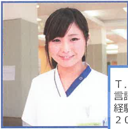
T. M 言語聴覚士 (リーダー) 経験 10 年目 2014 年中途入職