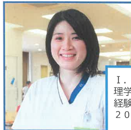
I. N 理学療法士 経験5年目 2019年中途入職