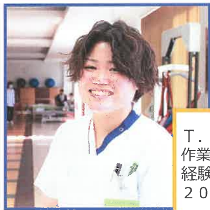
T. C 作業療法士 (サブリーダー) 経験 6 年目 2015 年新卒入職

新潟県出身、新卒で当院に入職しました。明るい職場で学校の先輩がいたことが大きかったです。現在5年目となり、やりたいことを積極的に経験させてくれた上司に感謝しています。元々、心臓リハビリに興味があったため、「心リハチーム」で患者様に対応しています。各領域で専門のチームがあることで、高度な知識、スキルを学ぶことができ大変刺激になります。この「層の厚さ」が当院の魅力の一つでもあります。リーダーとして若手をまとめるのは大変ですが、研究発表含め、一緒に頑張っていきたいです。