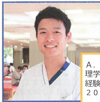
A. K 理学療法士 (リーダー) 経験 6 年目 2015 年新卒入職