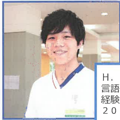
H. G 言語聴覚士 経験 1 年目 2019 年新卒入職