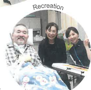
レクリエーション REC