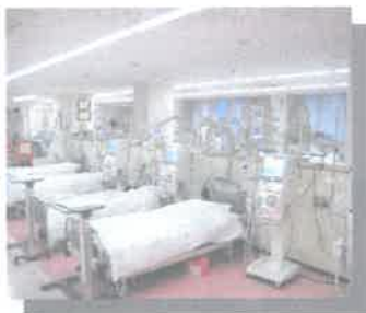
人工透析センター