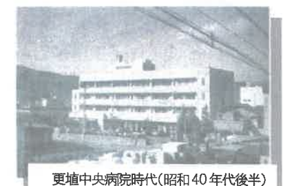
更埴中央病院時代(昭和40年代後半)