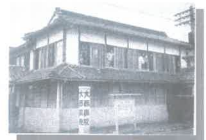
大西病院時代(昭和30年頃)