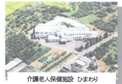
介護老人保健施設 ひまわり