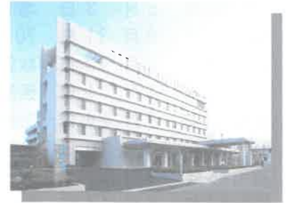
第5期新本館増築及び既存棟改修工事 竣工 25年10月31日