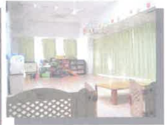
院内託児室(本館5階)