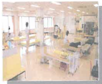
リハビリテーションセンター