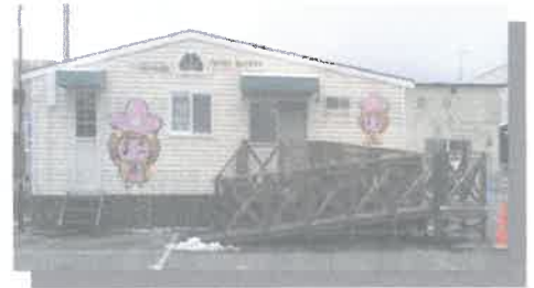
「病児・病後児保育室」(トレーラーハウス) 千曲市委託事業 28年3月1日～OPEN