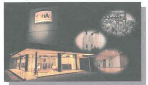
メディカルフィットネス&トレーニングセンター 「VITAS」ヴィータス 28年7月2日～OPEN