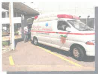
365日24時間 二次救急対応